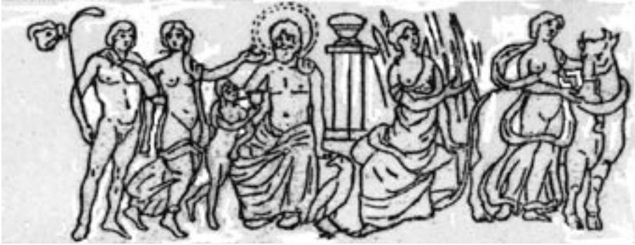
Figura 1.- Esquema de la escena del rectángulo central del mosaico argelino de Ouled Agla (Borj Bou Arréridj) con los amores de Zeus. Museo de Argel. Según S. Reinach.

Asimismo este mito de Antíope se describe en un mosaico que se data entre fines del siglo III y los principios del IV d.C. y que se halló en la localidad argelina de Ouled Agla (Bordj bou Arrérid) 39 . Expuestos sus fragmentos en el Museo de Argel 40 , en él, frente al espectador y en alegre maridaje, Antíope y el sátiro han sido presentados en la escena central de este mosaico junto a los personajes y al principal protagonista de algunas de esas aventuras amorosas de Júpiter: el joven Ganímedes escanciando la copa a un sedente y nimbado padre de los dioses, Antíope con el sátiro que lleva en su diestra el cayado de los pastores ( pedum ), Leda con el cisne?, Europa acariciando al toro y Dánae sentada recibiendo la lluvia de oro 41 .