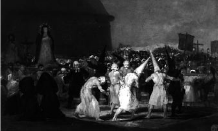
Procesión de flagelantes (1812-1819). Autor: Francisco de Goya y Lucientes Museo de la Real Academia de Bellas Artes de San Fernando (Madrid, España).

locales, sentando así un precedente para las celebraciones de las siguientes décadas, según relatamos a continuación.