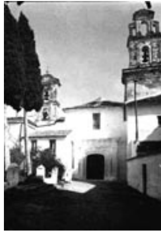
Izquierda: Jesús Nazareno de la Sangre (1590). La imagen representa la aceptación de la Cruz por el Redentor y el inicio del itinerario hacia el Monte Calvario. Derecha: Portada de la iglesia antequerana de San Zoilo (mediados del siglo XX). Templo-sede de la Cofradía de la Vera Cruz y Sangre de Jesucristo

Sin embargo, la difusión de estas asociaciones no está exenta de polémica. Fueron muchas las denuncias apuntadas en los actos de Semana Santa, celebrados en las distintas diócesis españolas, a partir de la decimosexta centuria. Entre ellas, sobresalen las realizadas por el arzobispo sevillano, don Cristóbal de Rojas, quien a instancia del monarca Felipe II, informa y evidencia la promiscuidad y falta de respeto mostrada por los fieles y penitentes a lo largo de los extensos y concurridos recorridos, siempre en horas nocturnas, llegándose a realizar, incluso, paradas para la venta y consumo de comida. El profundo deseo de reforma espiritual, imperante en el reinado del segundo Austria español, se deja sentir en este asunto 14 . Sorprendentemente, las pesquisas encargadas por el soberano a sus prelados, difieren del tono negativo del metropolitano hispalense. Existe unanimidad en conservar la tradición de procesionar el Jueves Santo por la noche, y si alguno aconseja el horario diurno —tal es el caso del obispo de León, don Juan de San Millán—, no es para prevenir altercados, sino por un simple motivo