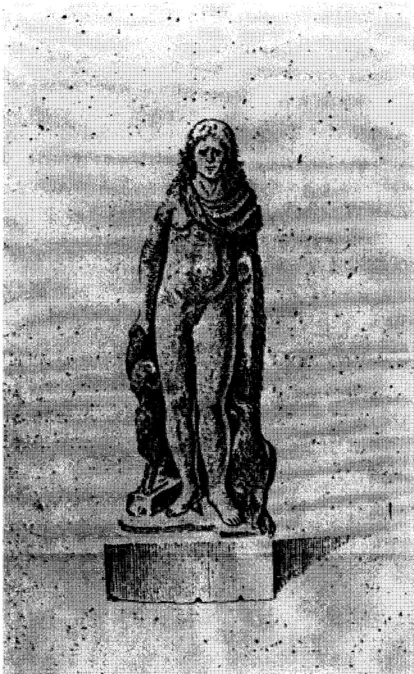
Lámina 1. Escultura de Adra según F. Pérez Bayer